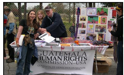
Voluntarios con la mesa de GHRC