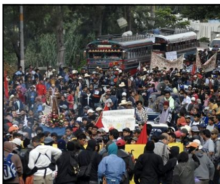
Miles de vecinos de San Juan Sacatepéquez participaron en una marcha hasta el Palacio Presidencial para protestar contra la mina el 13 de julio del 2009.

Oficiales de gobierno y compañías mineras respondieron violentamente. Manifestantes contra las minas fueron golpeados, bombardeados con gas lacrimógeno y arrestados, las libertades civiles fueron suspendidas y líderes de las manifestaciones sufrieron de multas extremas. Unos líderes de manifestaciones fueron acusados de terrorismo y homicidio. Han habido muchos homicidios, con cada lado acusando al otro de los crímenes.