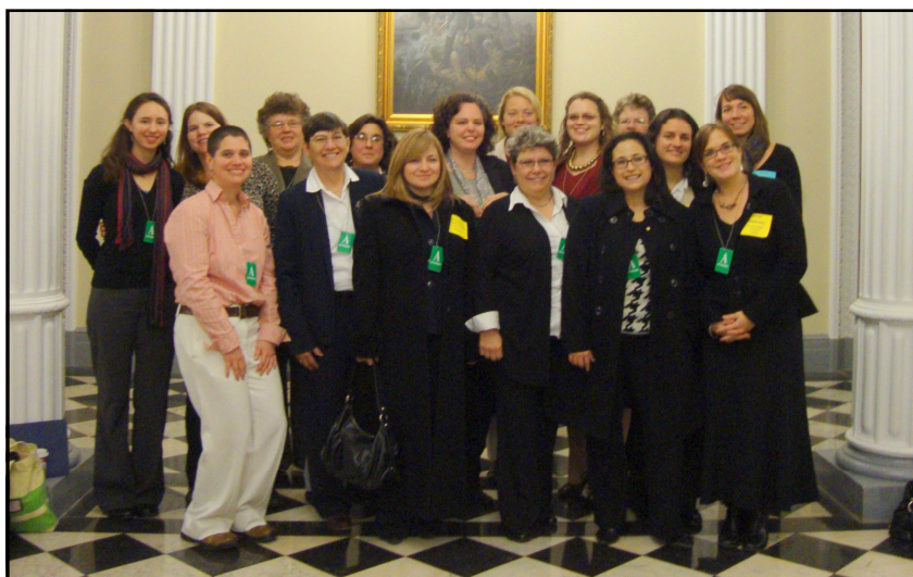
Delegados de GHRC y compañeros de la Universidad de Virginia Commonwealth, la Universidad del Estado de Pennsylvania Altoona, y la Alianza de acción en violencia sexual y doméstica del estado de Virginia después de una reunión con Lynn Rosenthal, asesora de la Casa Blanca en Violencia Contra las Mujeres.

mas enfocados en violencia contra las mujeres. En 2008, fondos aumentaron a $12.500 para apoyar a la Fundación Sobrevivientes. En 2009, esta cantidad bajó a $12.149. Para comparar, desde 2007 Estados Unidos han donado seis helicópteros de Huey II Bell con un valor total de $42 millón.